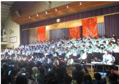
6年生「繋~伝えよう136の思い~」