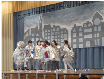
5年生「グレートパワー」