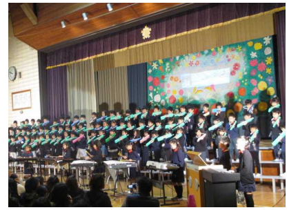
2年生「ぼっかぼかのおくりもの」