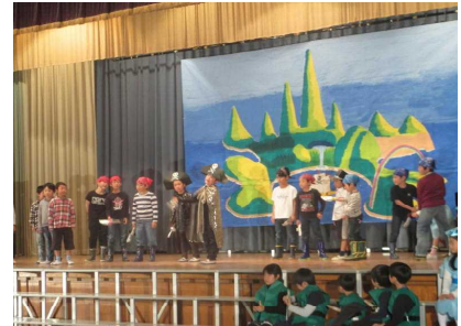
3年生「ピーターパン」